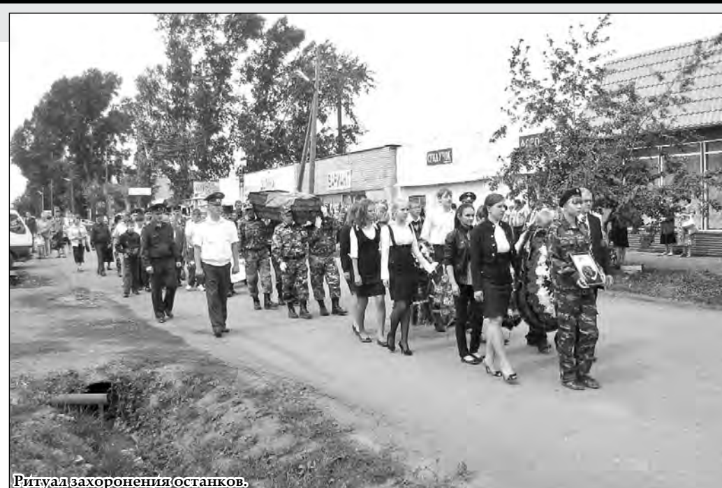
Ритуал захоронения останков.

4 мая 2011 года поисковая группа «Броня» в лесном массиве в полутора километрах от деревни Табаково Зубцовского района Тверской области обнаружила останки бойца. Он лежал на дне окопа, при нем