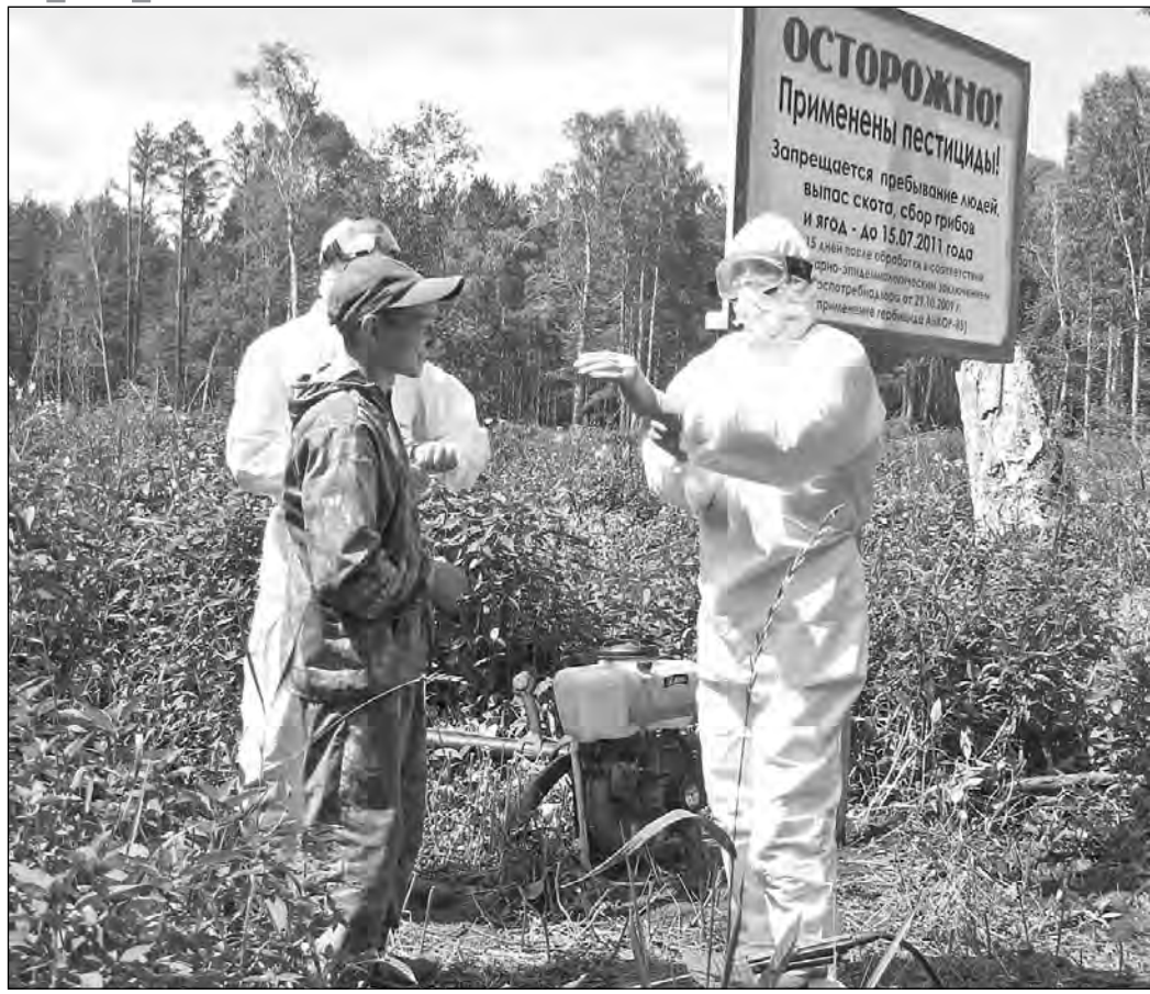
Химический уход за саженцами.

По данным пресс-службы департамента Лесного комплекса области, на лесозооэкономическую деятельность в структуре областного промышленного производства приходится около 1% общего объема производства товарной продук-