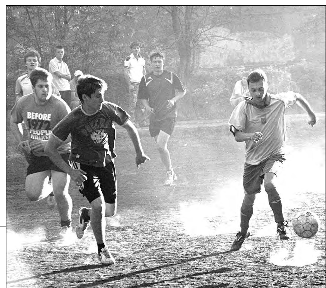
Теперь у самых способных мальчишек, гоняющих мяч на дворовых площадках, появится больше шансов dorasti до профессионалов.