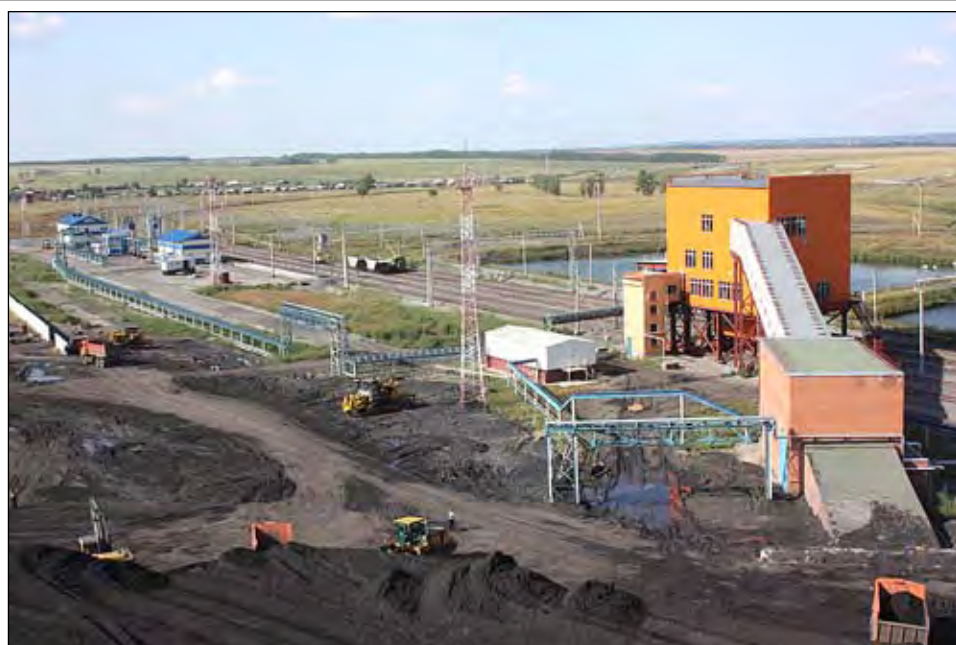
Шахта «Костромовская». Погрузочный комплекс.

– Большую часть угольного производства «Белона» составляет добыча ценных коксующихся марок угля, востребованных в металлур-