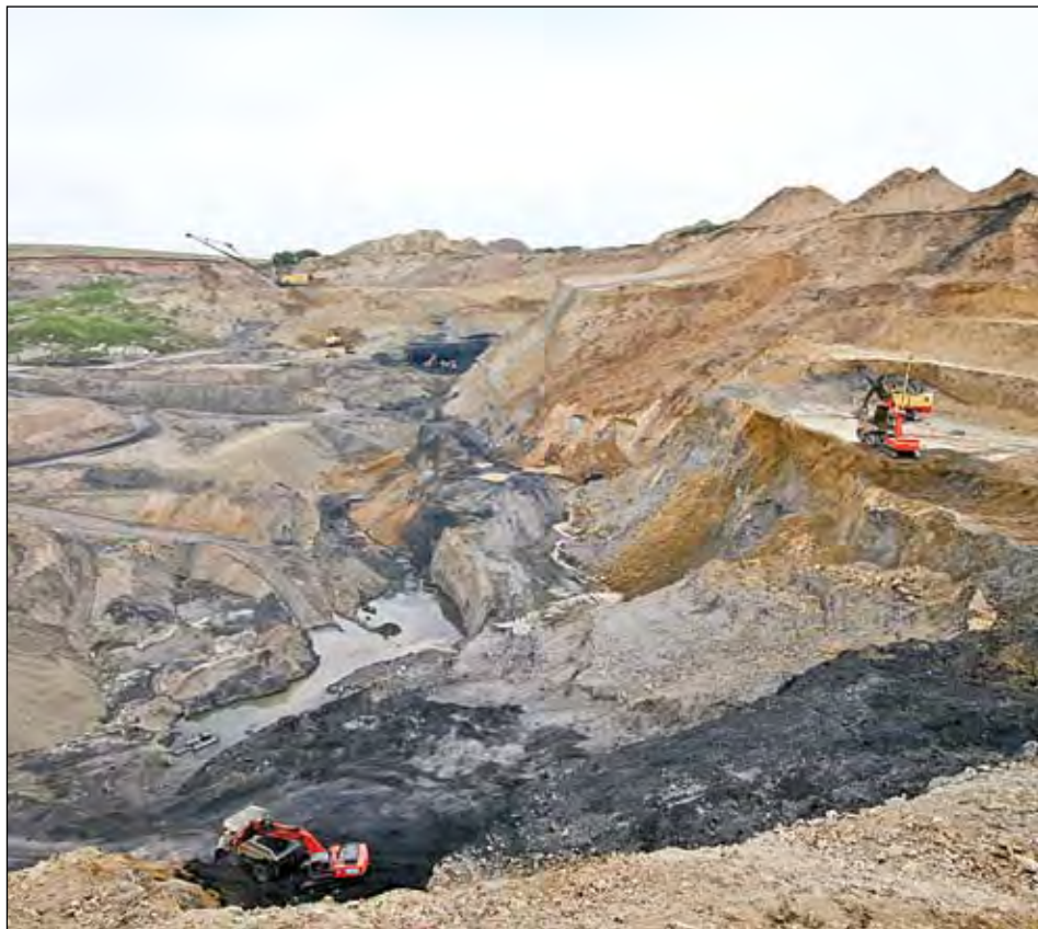
На сегодня, как генеральный проектировщик, «Кузбассгипрошахт» ведет более 50 крупных угледобывающих предприятий Кузбасса.