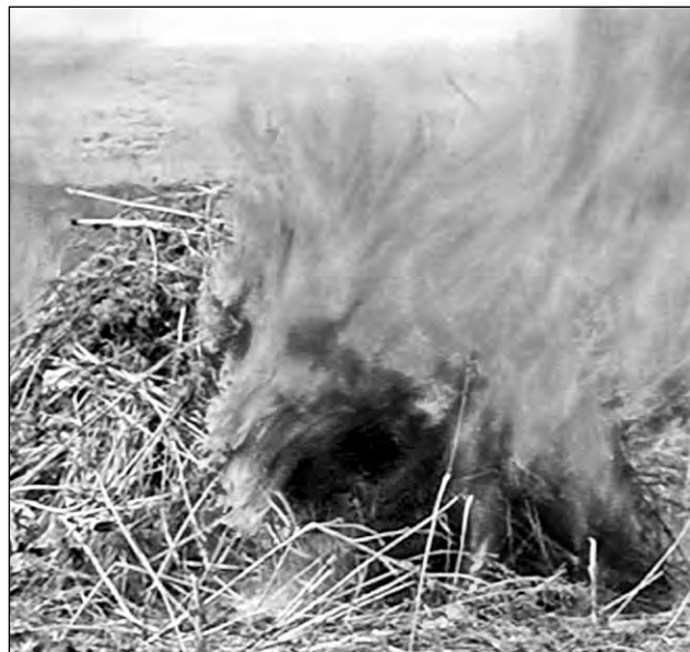
За три последних месяца в Кемеровской области было уничтожено свыше 372 гектаров дикорастущей конопли – это примерно 4,5 тысячи тонн дурманящей травы.

В Кемеровской области, который на днях станет столицей всекузбасского шахтерского праздника, сотрудники милиции уничтожили плантацию дикорастущей конопли.