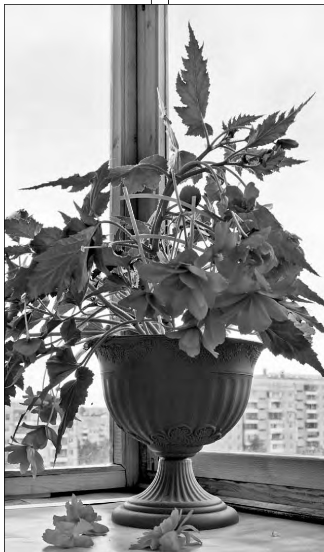
Бегония клубневая сорта Водопад Виктория.