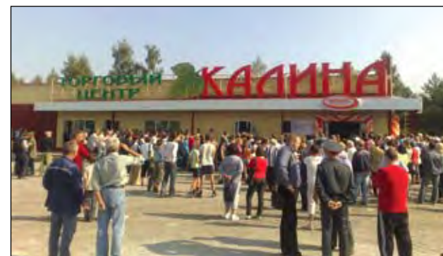
Торговый центр «Калина» пгт Краснобродский.

ТЦ «Калина» был спроектирован с учетом характера и потребностей небольшого города: специально не стали строить в высоту. Почти на 1500 кв. метрах центра разместились продуктовый магазин «Чибис», аптека, торговая галерея и фуд-корт. Для посетителей построена бесплатная парковка на 100 машин. «Калина» стала своего рода пионером – это первый проект подобного формата в 12-тысячном поселке. Теперь