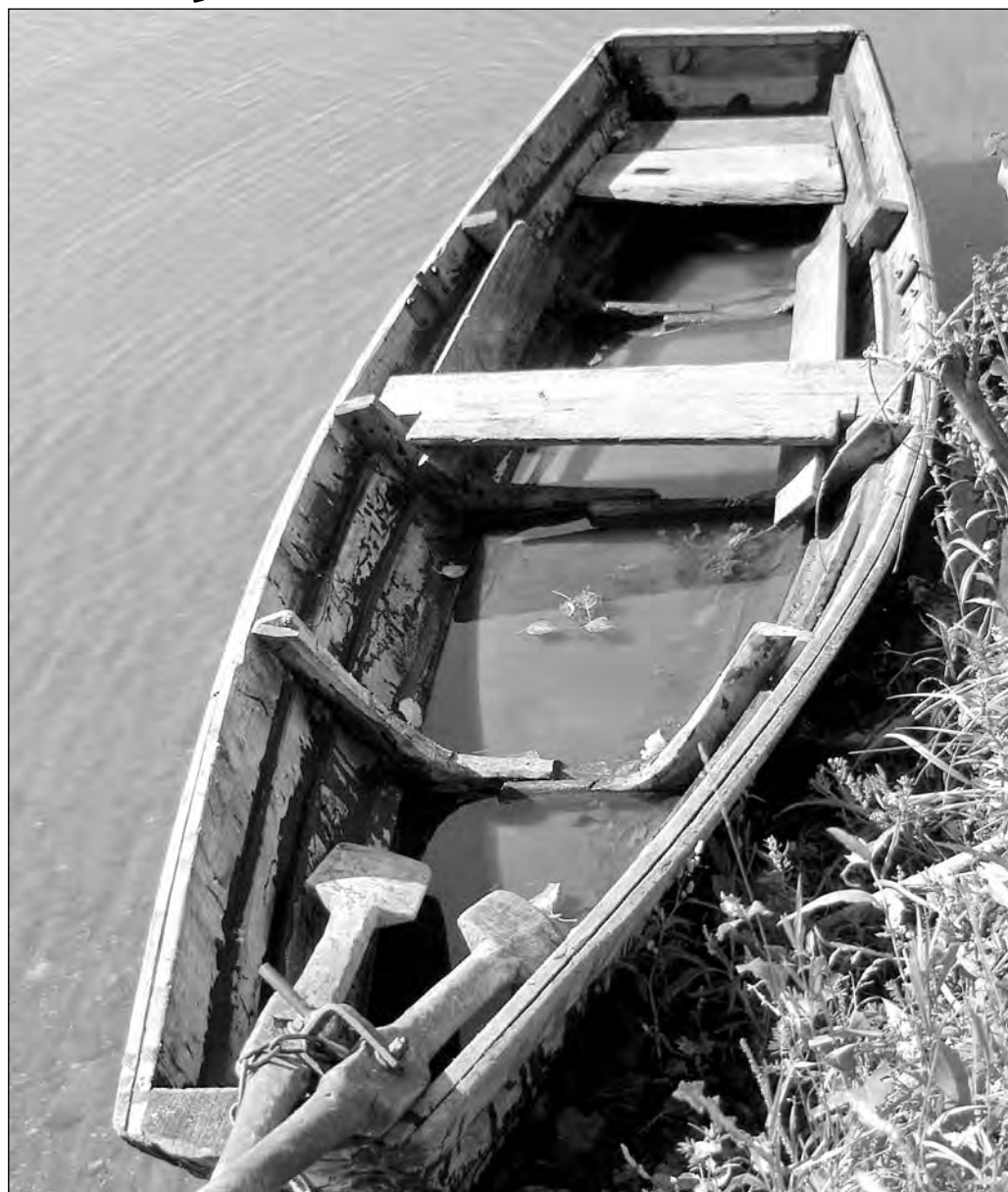
Бесла если и мокнут, то только на берегу.

В 2005 году базу ГПХ «Тисульское», которая располагается на берегу озера Боль-