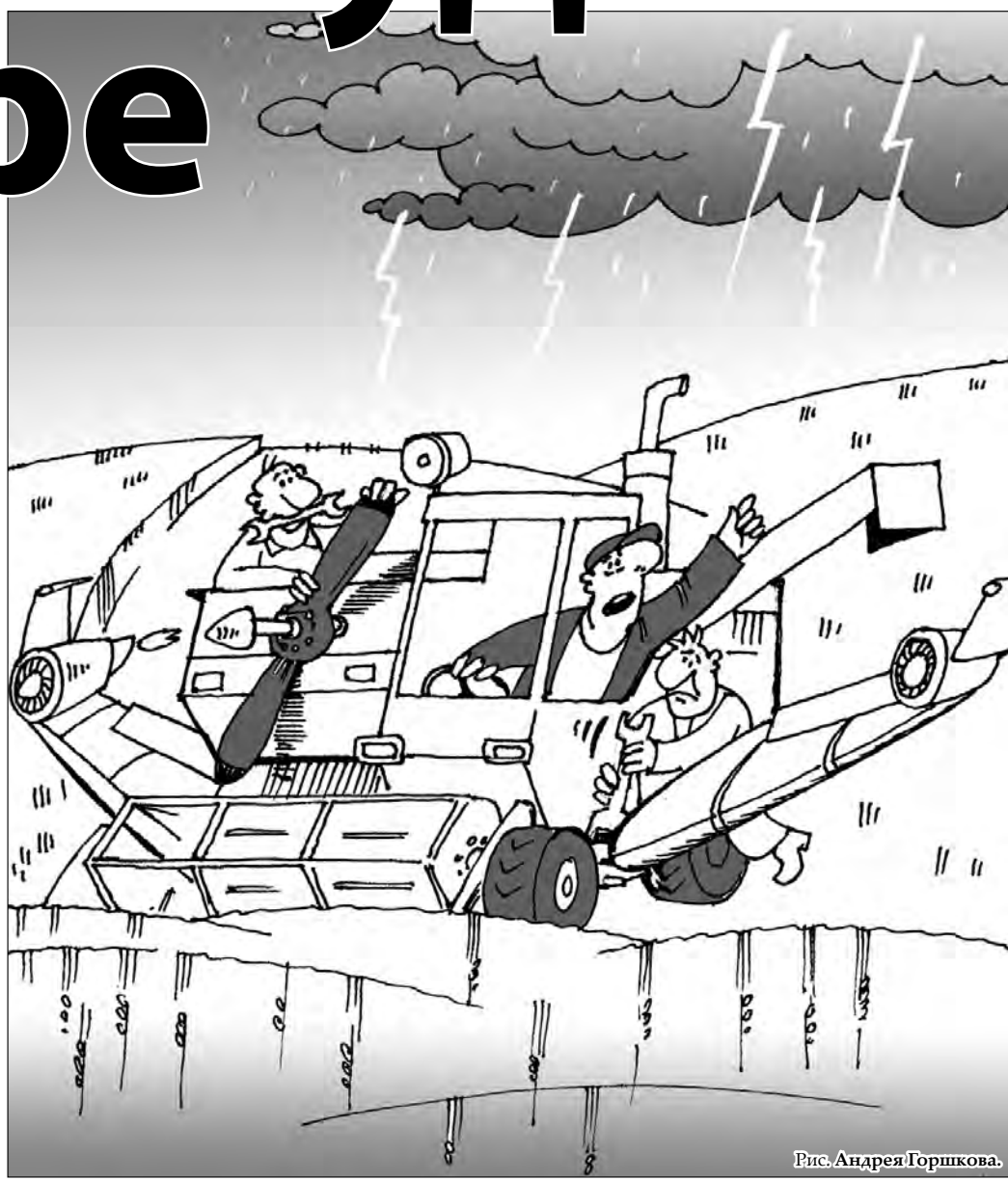
Рис. Андрея Горшково.

Цены, складывавшиеся на рынке зерна за последние пару лет, не позволили селу приобретать новую технику, в том числе комбайны. Нагрузка на них очень высока – под 400 гектаров на каждый. Для сравнения: в советские времена нормальной считалась нагрузка на комбайн в 100 гектаров. Да, нынешние «Дон-1500» или «Акрос» заменяют 3-4 старых «Енисей» или «Нивы», а около 15 процентов кузбасских комбайнов вообще импортные, это совершенно другая производительность. Но вот настораживающие цифры: если (данные сельхоздепартамента) в 2008 году в Кузбассе насчитывалось 2202 комбайна, то в 2009-м их число сократилось до 2080, а ныне осталось 1971. Сокращение числа комбайнов произошло не только за счет списания безнадежно устаревшего металлолома, но и из-за возврата должниками техники, за которую