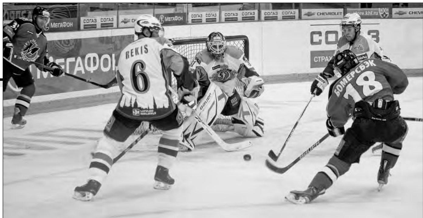
хоккей с шайбой

отвод войск из Москвы по Рязанской дороге. Французы входят в город. К вечеру Кремль занят гвардией Наполеона. Начало пожаров в Москве. Отнем будет уничтожено две трети домов, торговых рядов, лавок и фабрик. 1867. Вышел в свет «Капитал» Карла Маркса.