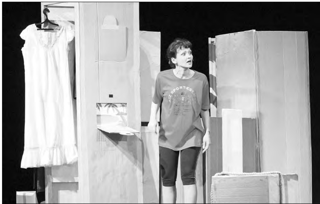
Сцена из спектакля «Целлофан» Кемеровского областного театра драмы.