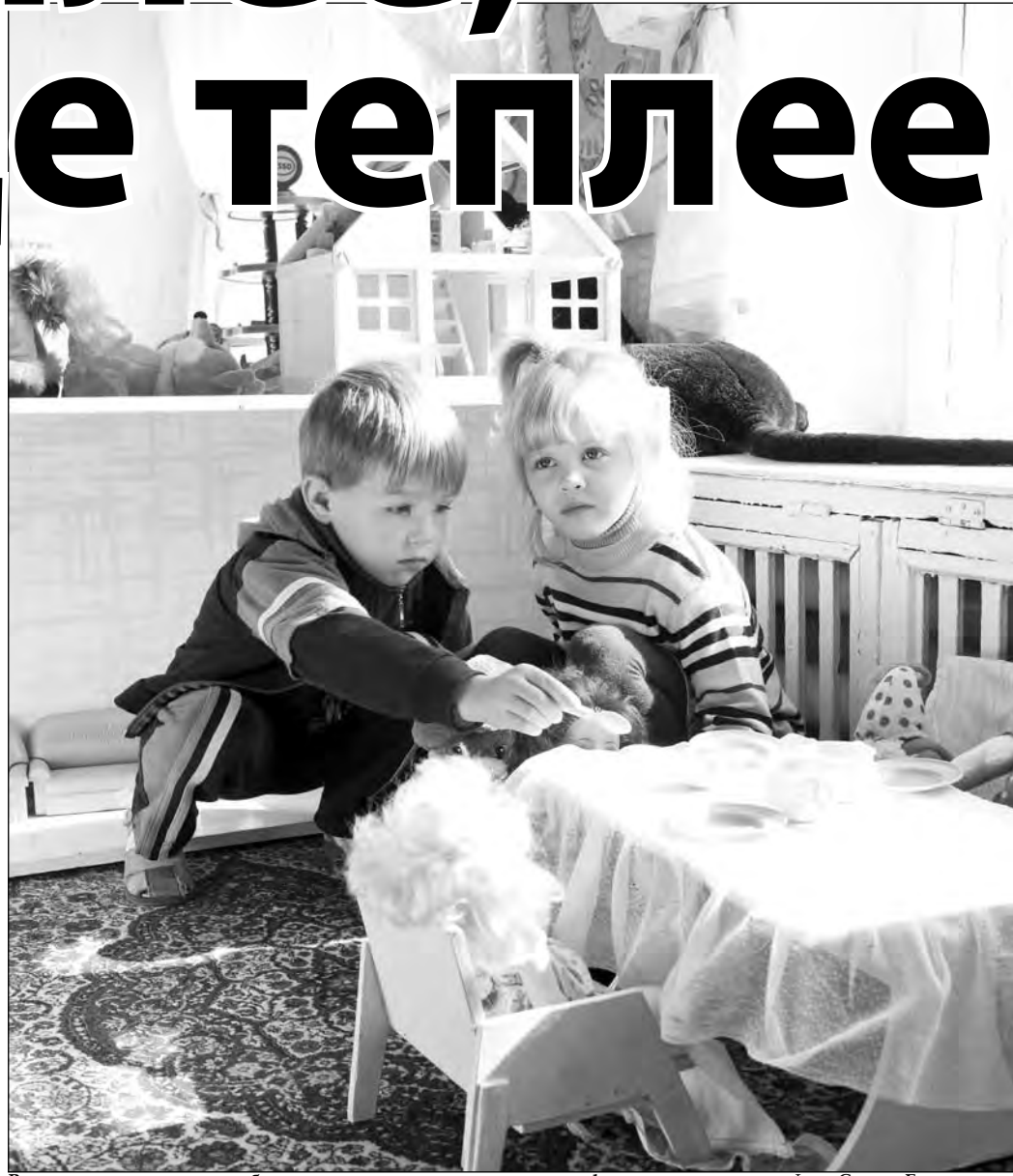
В кемеровских детсадах ребята уже сегодня могут снять кофты.