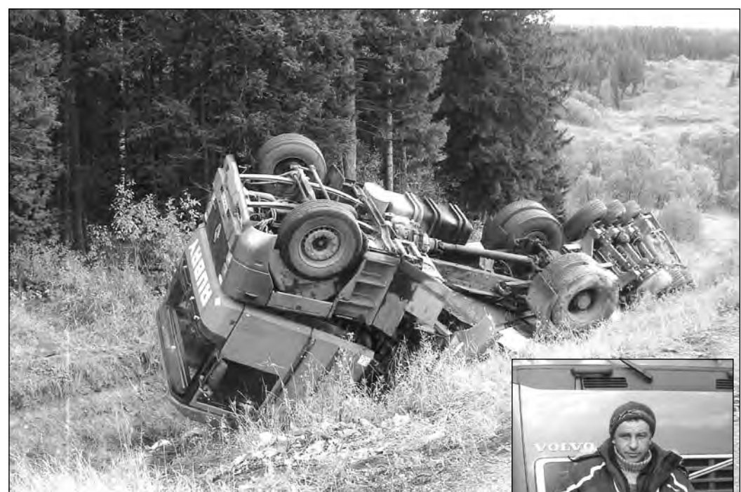
Громадный «Рено» перевернулся как игрушка.