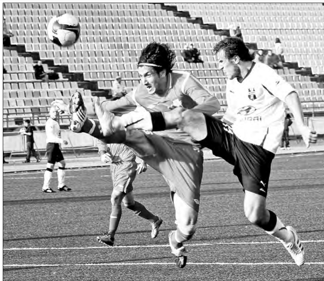
Момент матча «Кузбасс» - «Радийн-Байкал».

В отличие от профессионалов, кузбасские любители в минувшие выходные своих болельщиков порадовали. Футбольный клуб «Распадская» из Междуреченска, сыграв в Рубцовске с местными «Торпедо» вничью со счетом 0:0, за тур до окончания регионального первенства страны среди коллек-