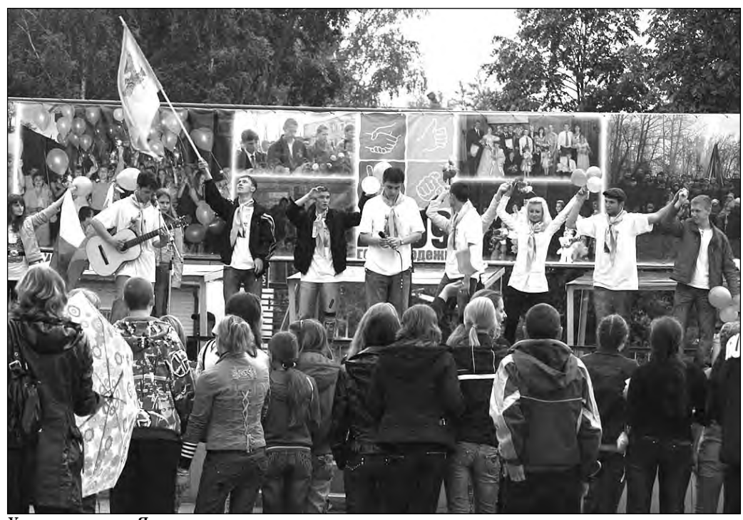
Уличная акция в Яшкино.

– Помимо обмена шприцев и консультирования всех обратившихся на стационарный пункт, мы сами «выходим в народ», –