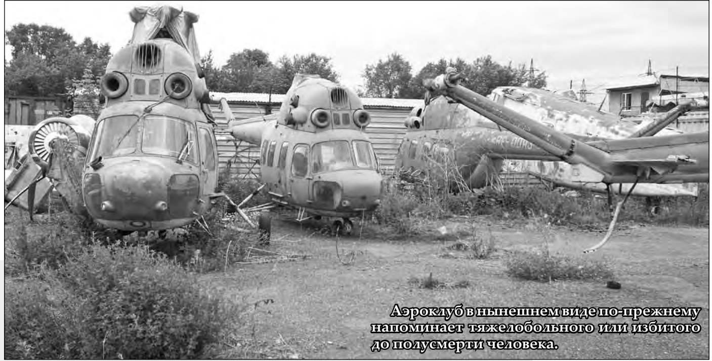
Аэроклуб в нынешнем виде по-прежнему напоминает тяжелобольного или избитого до полусмерти человека.