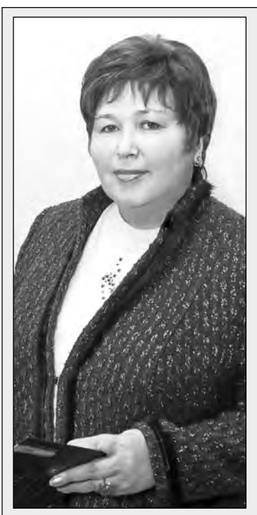
ДОСЬЕ. Образование - высшее, кандидат педагогических наук. Заслуженный учитель РФ, заслуженный работник социализации РФ. 25 лет отданы народному образованию. Заведовала соргоно 2. Кемерово, была зам. губернатора по социальным вопросам. Сейчас - советник губернатора, председатель областного совета ветеранов. Семья: любящая жена, мама, бабушка.