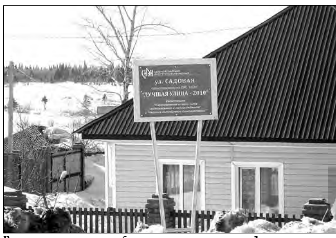
Вот такие памятные таблички установлены на «Лучших улицах».