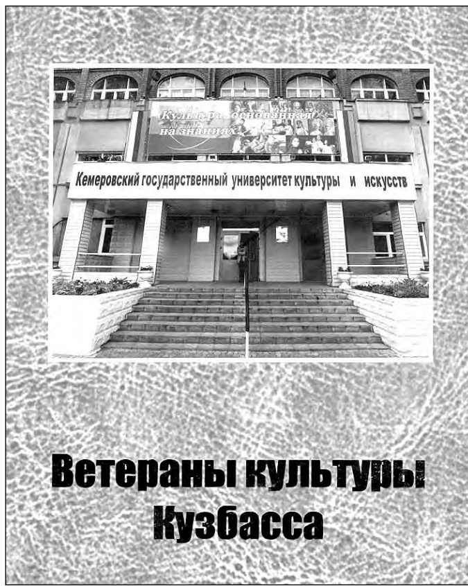
Ветераны культуры Кузбасса

В книге не случайно много места отводится орга-