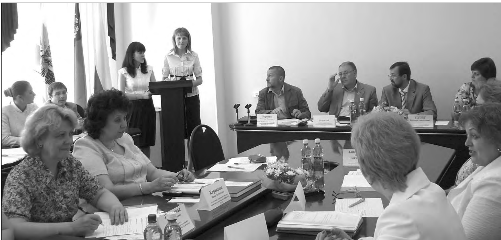
Идет защита дипломных работ.

Будущее любого города или поселка видится сегодня. Надо ли возводить новый стадион, школу или целый микрорайон - все это можно узнать из 223 комплексных программ социально-экономического развития муниципальных образований, реализуемых с 2007 года. Однако каждый год эти программы надо корректировать и актуализировать, в связи с чем нужны свежие идеи. И в ответ на призыв администрации области к студентам вузов поучаствовать в ежегодной корректировке комплексных программ развития муниципальных образований начаты крупномасштабные исследования. Результаты исследований рассмотрели в Кемеровском государственном институте Российского торгово-экономического университета РИТЭУ/ - всю нынешнюю неделю в этом вузе шла защита дипломных работ, выполненных по заказу администраций ряда муниципальных образований.