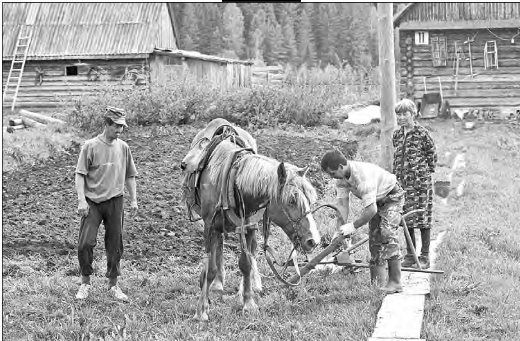
В этой деревне давно привыкли достойно выживать...

Небольшая шорская деревушка под названием Парлагол может показать пример стойкости, выживаемости и любви к родному пепелищу. Когда-то это было довольно многолюдное поселение, а сегодня в нем проживают 13 семей. В основном пенсионеров. Расположена деревенька в семи километрах от Усть-Кабарзы, куда обычно парлагольцы приходят, чтобы прикупить в местном магазине продукты. Мы преодолели это расстояние за час. А пожилые парлагольцы проходят его, да ещё груженные продуктами, обычно за время чуть меньше нашего. Потому что путь этот знаком им с детства.