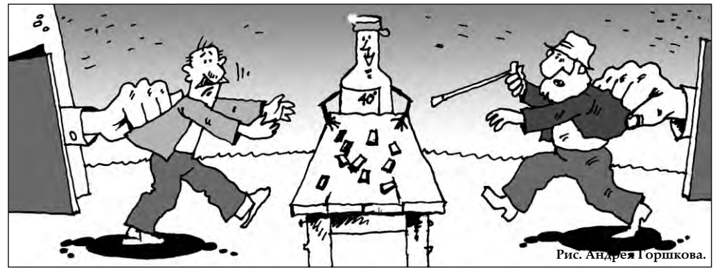
Рис. Андрей Горшков.

Великобритания, как и Россия, не может похвастаться трезвостью населения: страна занимает ведущее место в Западной Европе по