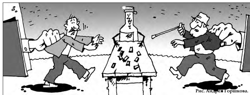
Рис. Андрей Горшков.

Великобритания, как и Россия, не может похвастаться трезвостью населения: страна занимает ведущее место в Западной Европе по