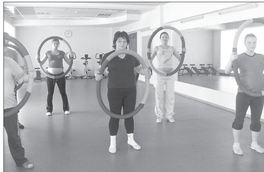
Анжеро-Судженск: бесплатный фитнес для беременных.