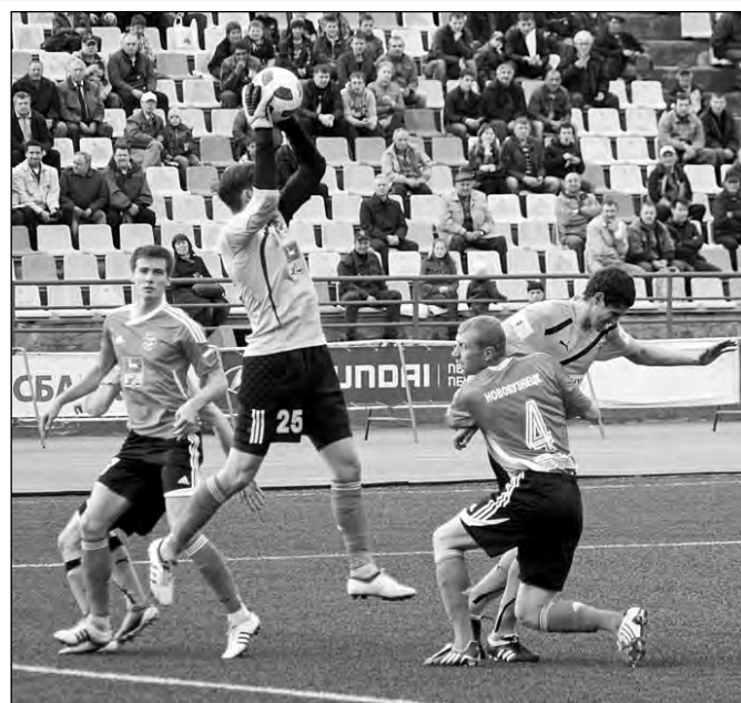
Кузбасские дерби традиционно проходят в упорной борьбе.