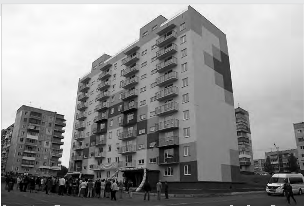
Доходный дом в Прокопьевске.

– Если посмотреть на подобные инвестиции с точки зрения коммерции, то для этого нужны очень «длинные» деньги. Если предприятие вкладывает деньги в строительство подобного рода объектов, значит, оно