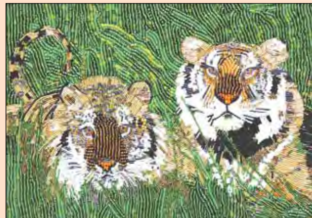
А вы смогли бы вот так вышить бисером? Если нет - сходите в Дом художника и позавидуйте!