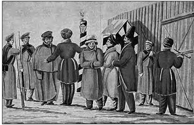
Декабристы у ворот Читинского острога зимой. 1828-1830 гг.