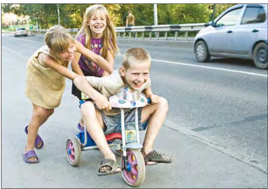
«Прокати нас, Шумахер, на велике!»