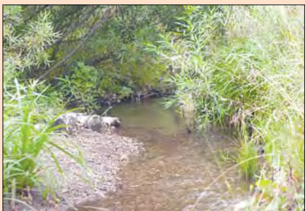
Этот ручей не зря назвали Золотым. И история у этих мест в Тисульском районе богатейшая...