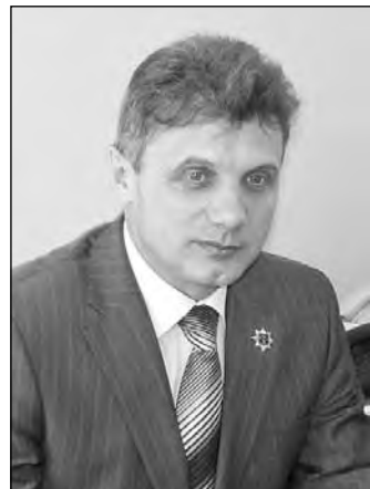
Военный комиссар Кемеровской области Герман Воробьев.

Как и прежде, наши призывники будут служить по всей России – от Калининграда до Владивостока. Однако если судить по прежним годам, то немало наших ребят оставались в Сибири. Минувшей весной, например, почти 400 кузбасских новобранцев были направлены в мотострелковую бригаду, расквартированную в Юрге. Правда, сейчас такой массовой отправки в Юргу ожидать вряд ли стоит, поскольку в этой войсковой части постоянной готовности опять хотят увеличить число военнослужащих по контракту. В то же время те, у кого есть малолетние дети, родители-пенсионеры или инвалиды, могут рассчитывать на службу неподалеку от Кузбасса. Например, в Новосибирской, Томской областях или в Алтайском, Красноярском краях.