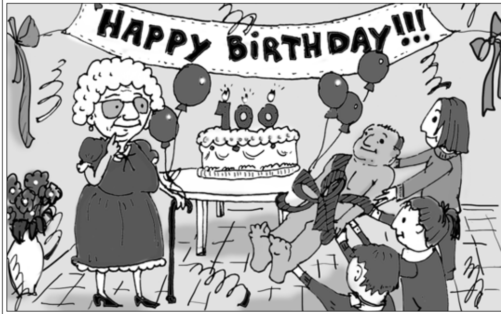
Рис. Дарьи Хмелевцевой.