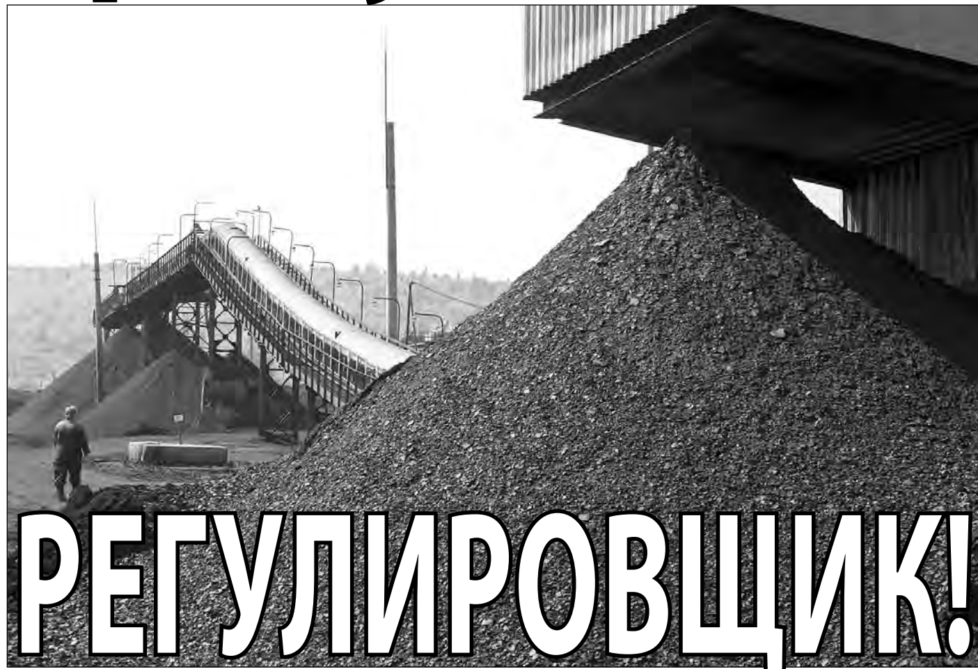
В Кузбассе угля сегодня — завались...