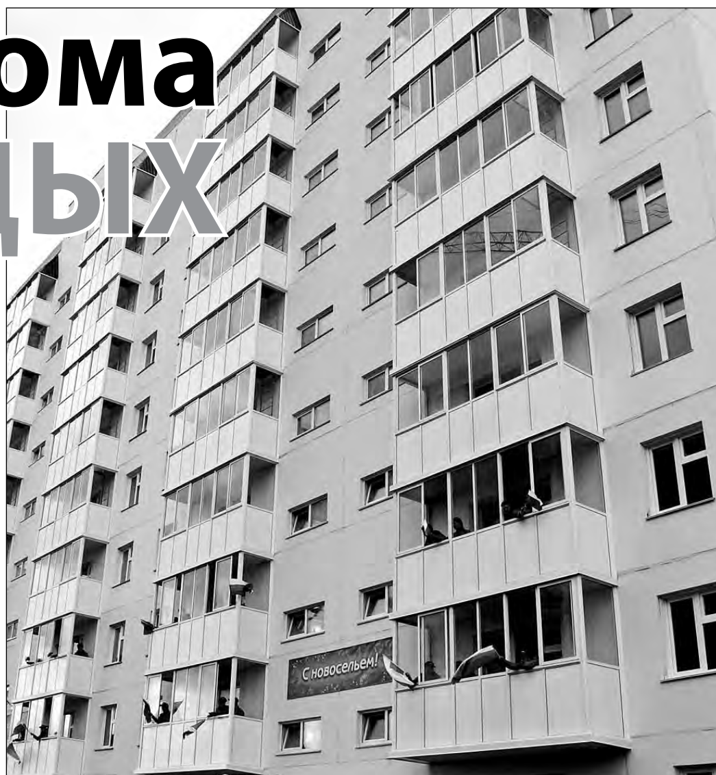
Доходный дом в Рудничном районе Кемерова.