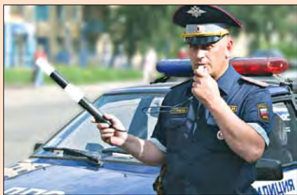
Мамам и папам - советы о том, как следует поступать. А автовладельцам - как поступать не стоит... Точнее, стоит все дороже...