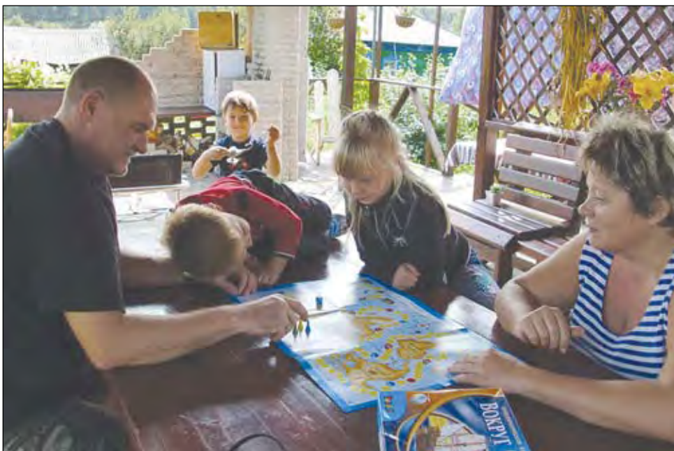
Хороший способ выучить язык - общение в русскими детьми.

В прошлую субботу (№ 193 за 15 октября) в материале «В гости за дешево и душевно» мы рассказали о том, как кузбассовцы «экономно, но эффективно» познают мир, используя международное движение каучсерфинг. И упомянули, что приезжавшие к нам с ответным визитом датчане настолько поразились городом Кемерово и вообще Кузбассом, что захотели открыть у себя в стране туристическое агентство для организации поездок сюда, в Сибирь. Их письмо, в котором они рассказывают о своих впечатлениях и намерениях, наверняка будет небезынтересно нашим читателям.