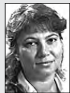
Ответственная за выпуск Елена ЦЕРБАКОВА.

Уважаемый читатель! По-прежнему ждем твоих вопросов. Пиши, звони. Наши телефоны: 72-50-45, 72-38-23.