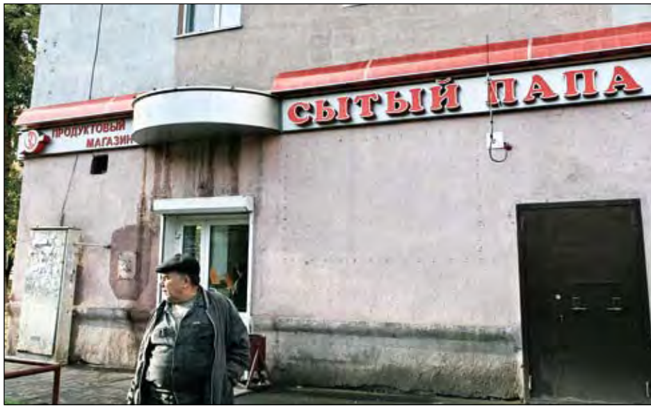
«И потому довольный...»