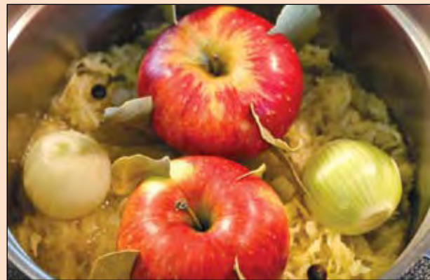
Русская народная загадка: не только полезно, но и вкусно. Что это? Правильно: тот самый овощ, которому сейчас самый срок.

Для самых продвинутых пользователей Интернета - новости про блогеров и аккаунты. Для самых равнодушных - комментарии по самым острым темам.