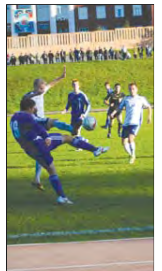
Ощутимая поддержка прокопьевских болельщиков не помогла «Шахтеру» в финальном матче Кубка Кузбасса с ФК «Кемерово».

сезоне решил выступать в четырех турнирах (помимо областных соревнований, это еще чемпионат и Кубок Сибири), причем на кузбасскую высшую лигу была «на амбразуру брошена» молодежь из «дубля». В межсезонье ходили слухи, что вторая кемеровская футбольная команда (после «Кузбасса») вполне может получить профессиональный статус. Наверное, даже к лучшему, что этого не произошло – нынешние недостатки результаты «горожан» говорят сами за себя. Да, в активе Кубок Кузбасса, но зато в пассиве – и вылет из розыгрыша Кубка Сибири в стадии всего лишь 1/8 финала после поражения от красноярской «Реставрации» (которая, впрочем, и стала обладателем трофея), и промежуточное третье место в чемпионате Сибири (вторая строчка у давних соперников – прокопьевского «Шахтера»), и полный провал в первенстве Кузбасса.