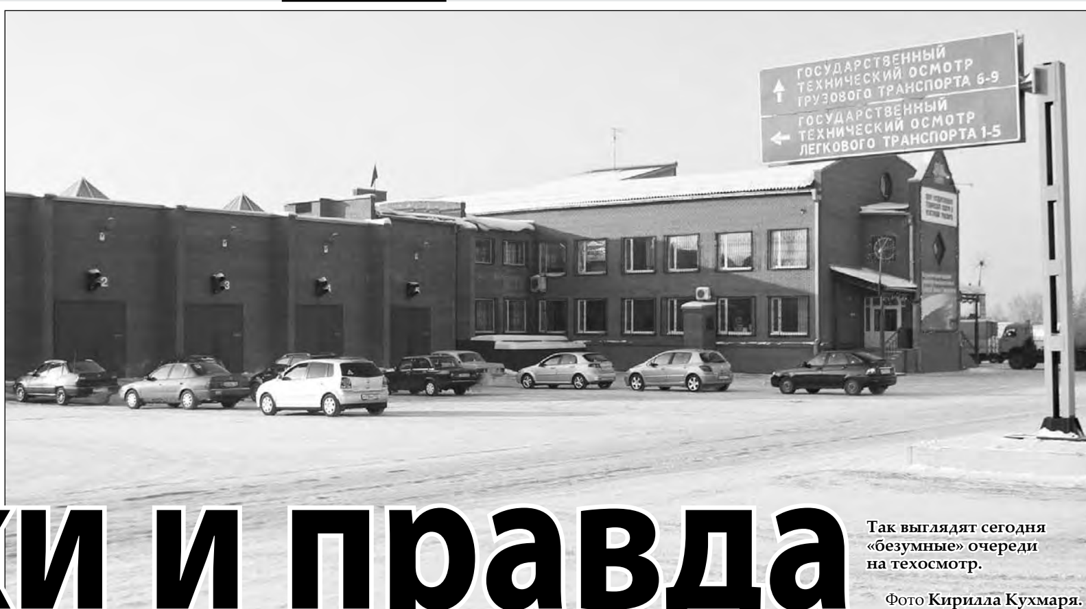
Так выглядят сегодня «безумные» очереди на техосмотр.

С 1 января начал действовать новый закон о техосмотре, предусматривающий новые правила страхования гражданской ответственности автомобилистов: теперь не техталон «привязан» к полису ОСАГО, а наоборот, получить «автогражданку» стало невозможно без техталона, действительного на полгода вперед. В связи с этим центральные СМИ уже сообщили о том, что на рынке автострахования России началась полнейшая неразбериха. Мы решили посмотреть, как обстоят дела в Кузбассе.