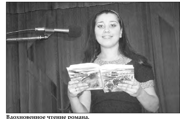
Вдохновенное чтение романа.