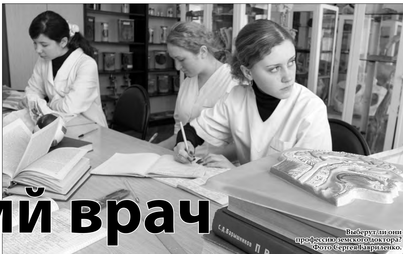
Выберут ли они профессию земского доктора?

Молодым врачам, согласным работать на селе, отныне будут выплачиваться подъемные в размере 1 млн. рублей. На это федеральный бюджет уже выделил Кузбассу 130 миллионов. Их получают доктора в возрасте до 35 лет, приехавшие в 2011-2012 годах в сельскую местность. Мера своевременная: дефицит врачебных кадров в сельском здравоохранении области составляет сегодня 827 человек, или 40% от потребности.