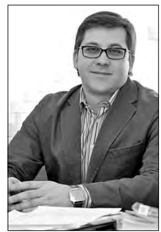
окончания школы, шансов сделать это стало больше. По крайней мере, есть пять попыток.

– В форме ЕГЭ ничего не меняется, но меняются сроки действия результатов экзамена – пять лет вместо одного года. Раньше результаты ЕГЭ были действительны до 31 декабря года, следующего за годом выпуска. Теперь у тех, кто не смог поступить в вуз сразу после